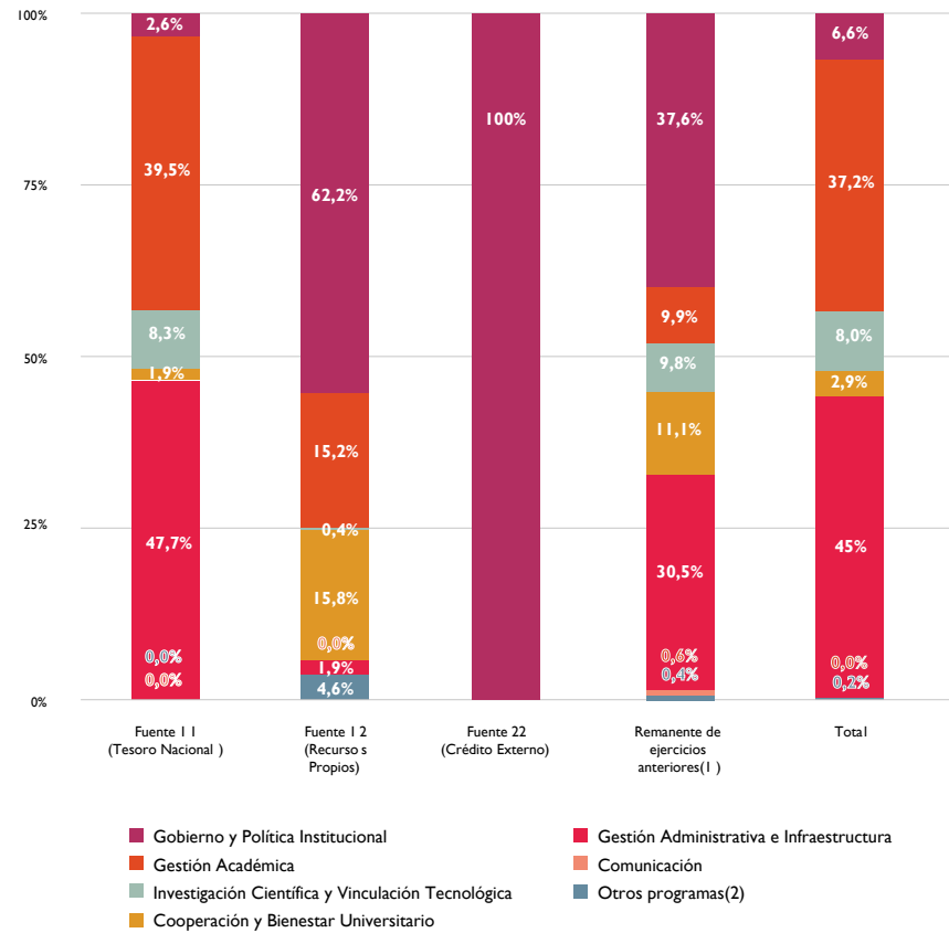
Gráfico 34: Distribución del devengado por programa al 31 de diciembre de 2021. Total UNLa y por fuente presupuestaria.

Notas: 1. Incluye los remanentes de años previos de las fuentes 11 (Tesoro Nacional), 12 (Recursos Propios), 15 (Crédito Interno) y 22 (Crédito Externo). 2. Corresponde a programas de redes presupuestarias pasadas: 16. Educación Universitaria; 18. Programas con Instituciones Estatales; 30. Proyectos de Investigación; 4. Convenios de la Dirección de Educación Permanente; 40. Programas y Convenios de Investigación; 8. Fondos Otorgados por Ley; 99. Históricos. Fuente: SIU-Wichi (Cubo Presupuestaria-Pilagá - Presupuestario).